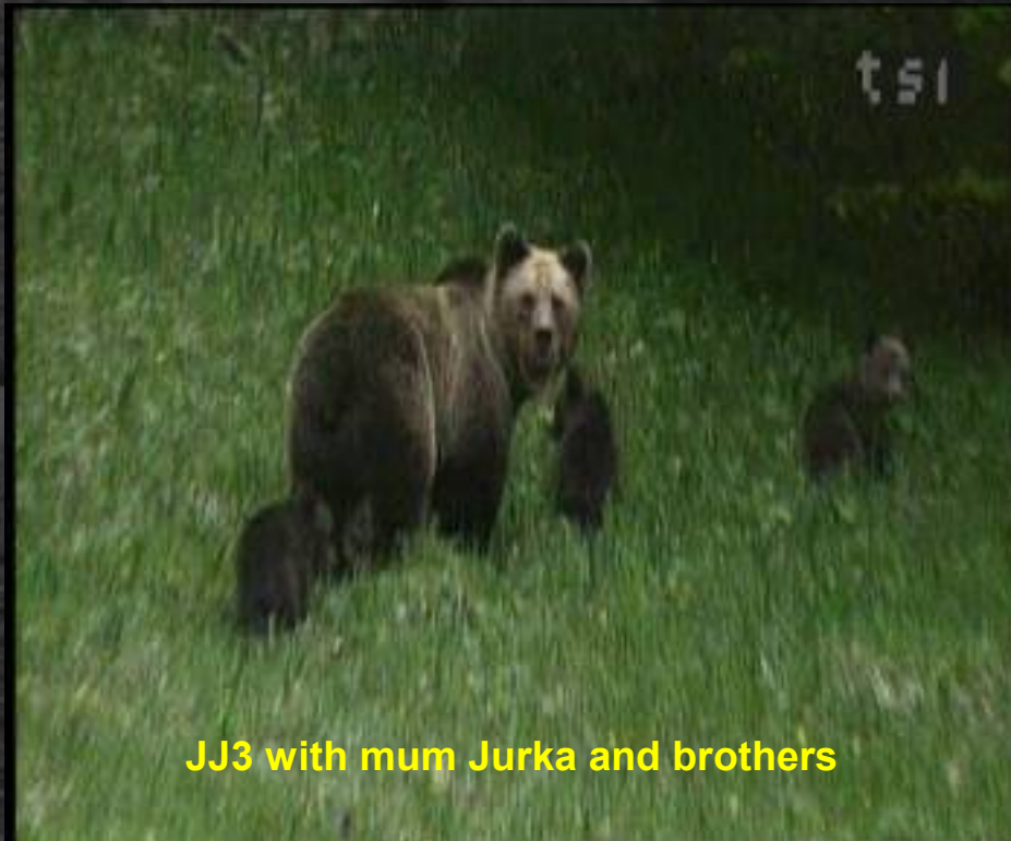
JJ3 with mum Jurka and brothers